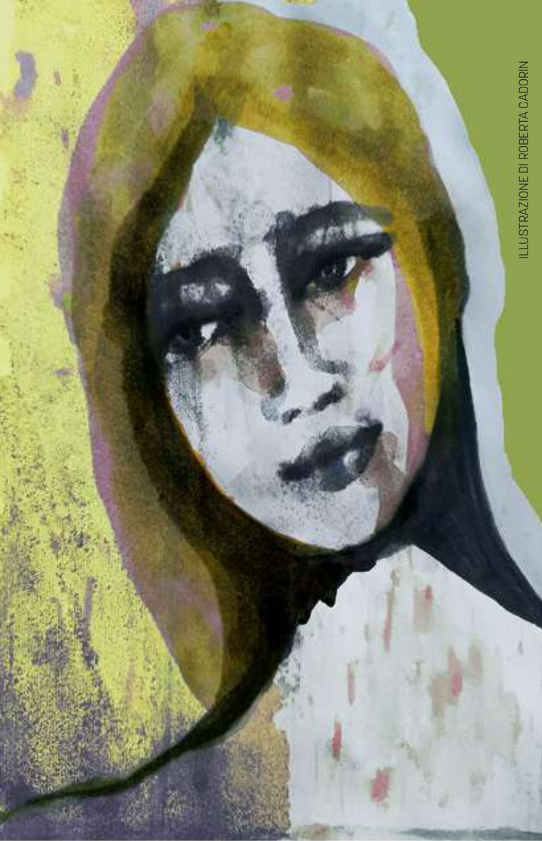
ILLUSTRAZIONE DI ROBERTA CADORIN

Leggero come neve il suo sguardo, salde come cime le sue spalle.