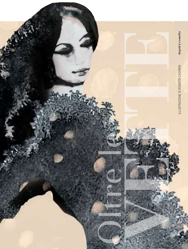
ILLUSTRAZIONE DI ROBERTA CADORIN

Agenzia Belluno Centro Francesco De Bon Agente