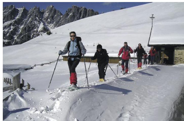
La Casera Malins