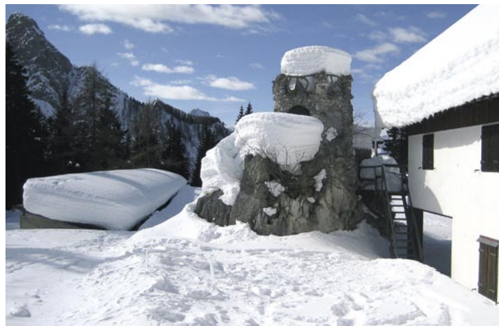
La Casera Bordaglia di Sotto, nella foto in alto la chiesetta nei pressi della casera