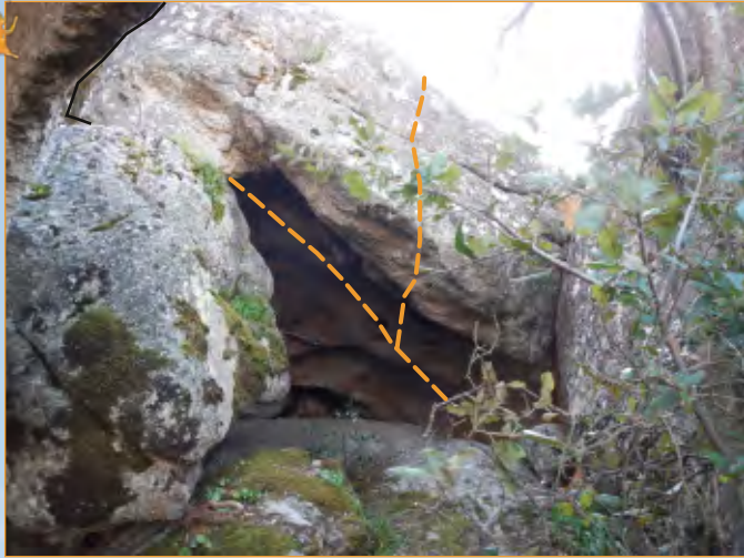
Blocco 25 - Settore 2