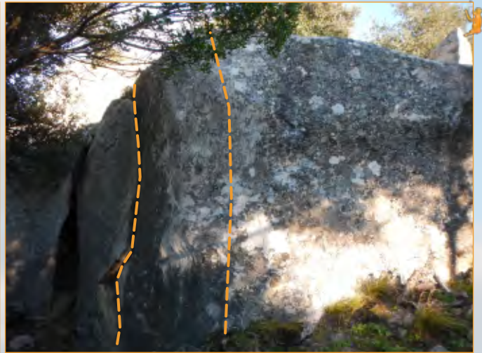
Blocco 16 - Settore 1