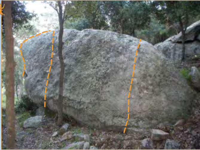
Blocco 13 - Settore 1