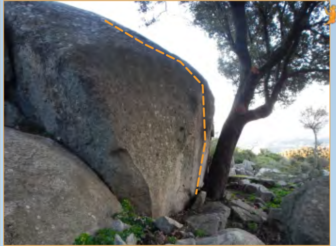
Blocco 2 - Settore 1