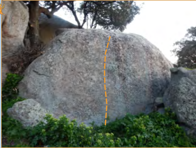
Blocco 1 - Settore 1