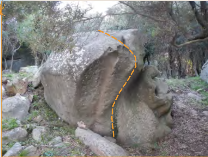
Blocco 3 - Settore 1