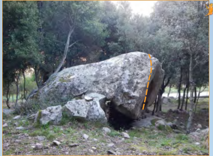
Blocco 14 - Settore 1