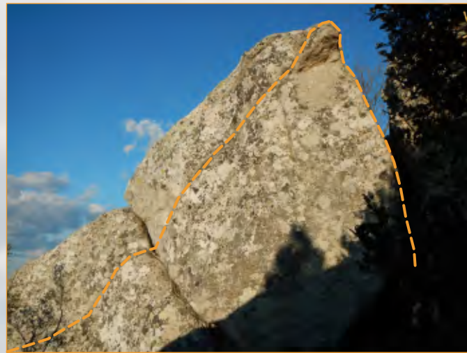
Blocco 27 - Settore 2