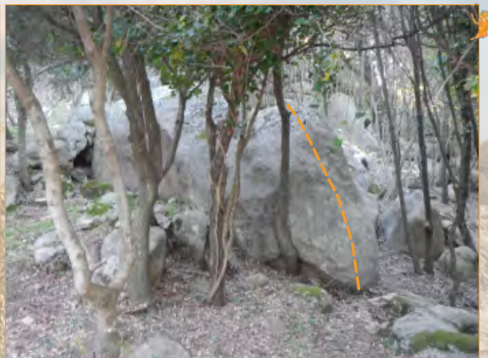
Blocco 6 - Settore 1