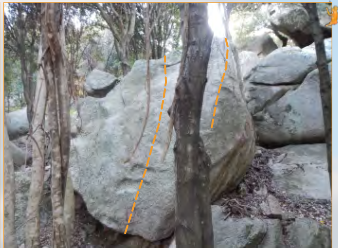
Blocco 10 - Settore 1