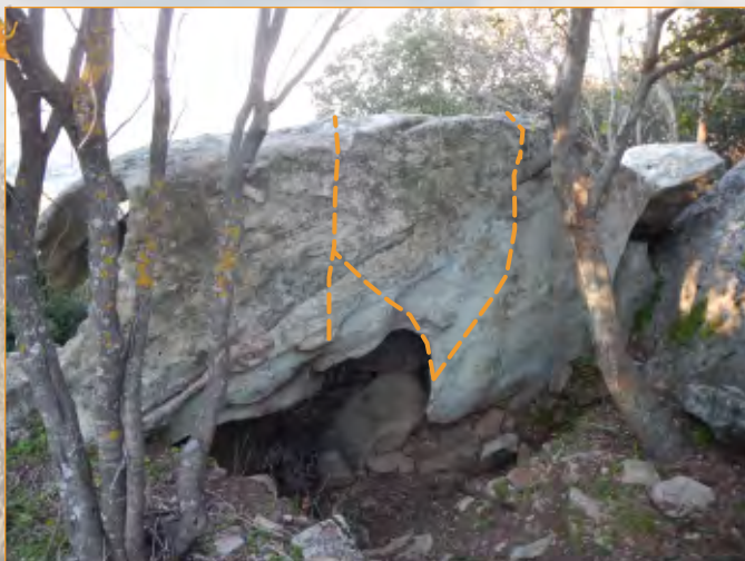
Blocco 17 - Settore 1