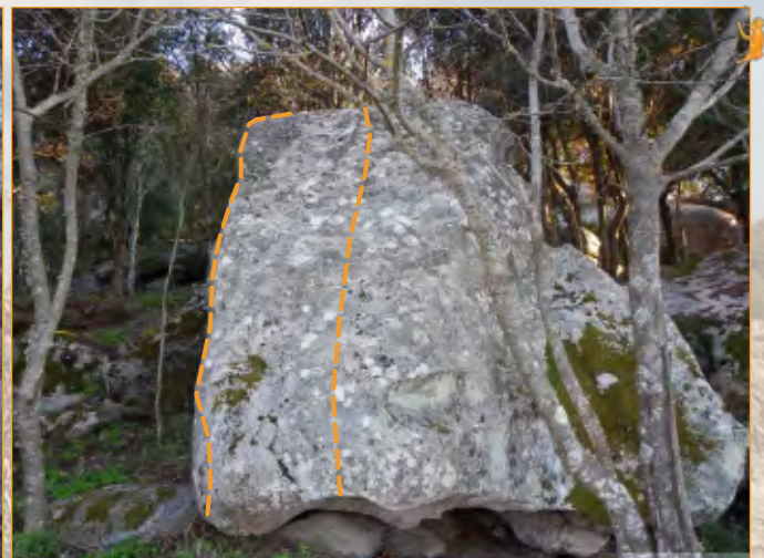
Blocco 24 - Settore 2