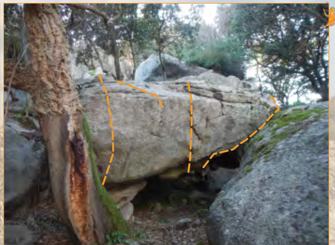
Blocco 12 - Settore 1