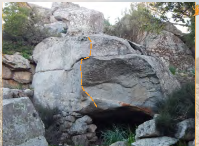
Blocco 18 - Settore 1