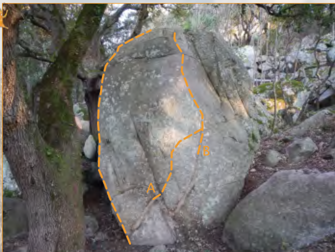
Blocco 23 - Settore 2