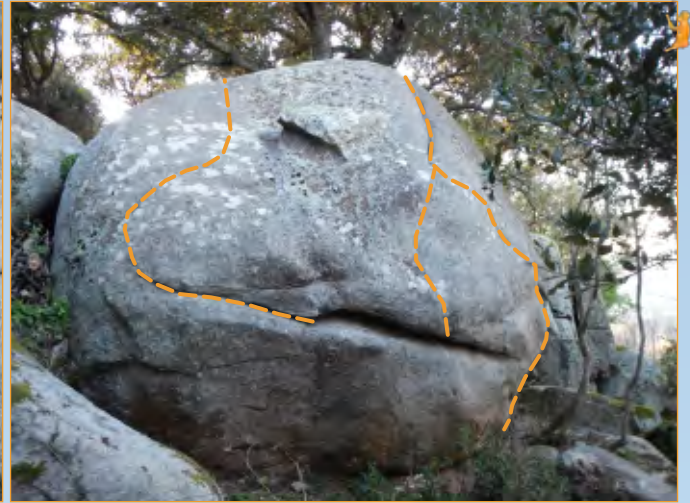
Blocco 20 - Settore 2