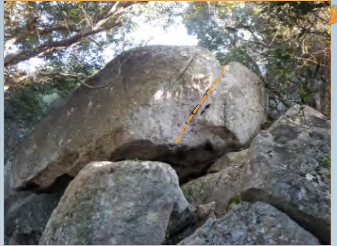
Blocco 8 - Settore 1