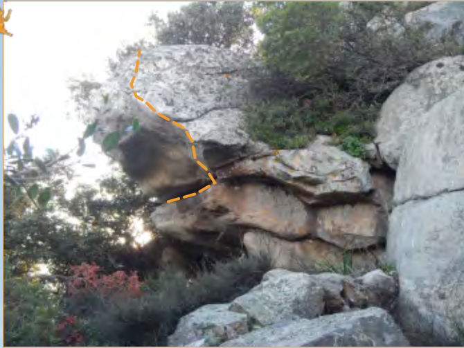
Blocco 19 - Settore 1