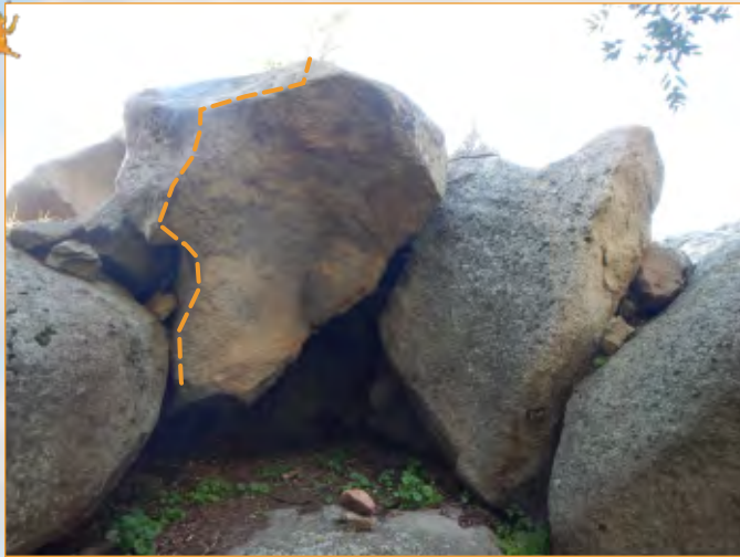
Blocco 15 - Settore 1