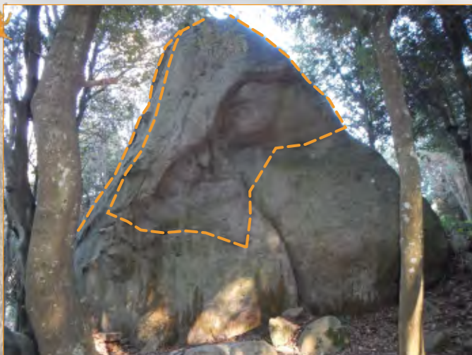
Blocco 5 - Settore 1