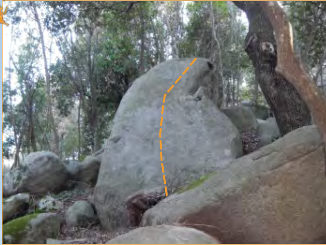
Blocco 7 - Settore 1