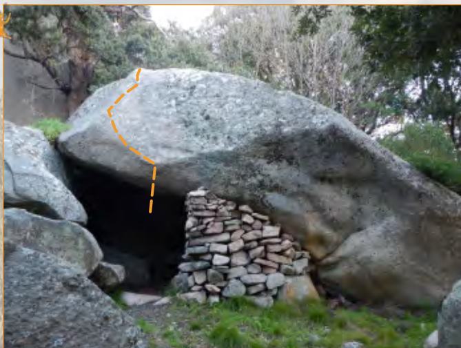
Blocco 11 - Settore 1