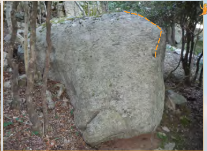
Blocco 22 - Settore 2