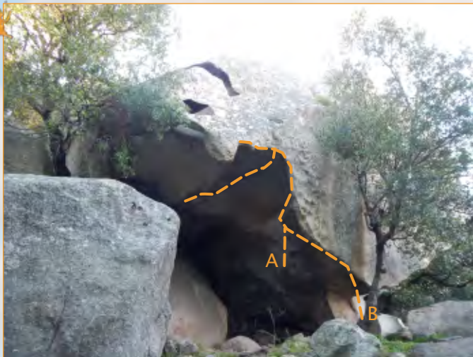
Blocco 9 - Settore 1