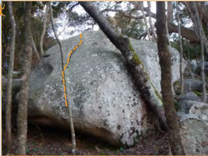
Blocco 21 - Settore 2