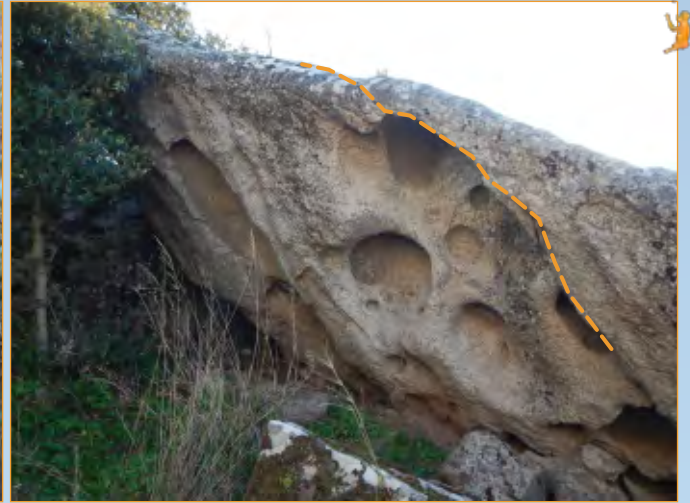
Blocco 26 - Settore 2