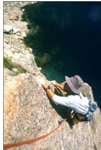
Prime lunghezze di Symphonie d'automne - Pointe de Sept Lacs, Vallée de la Restonica (Corsica).

Se vogliamo dunque delle scalate a spit dovremo invece scegliere tra delle vere vie stile big-wall, semi-attrezzate (talvolta difficilissime e quasi improponibili in un articolo destinato al pubblico di massa), e degli itinerari più abbordabili. Ma scegliendo ovviamente la seconda opzione, dovremo ancora distinguere tra