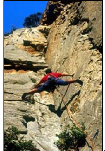
lunghezza in 5c di Ombre et Lumiere.

Il periodo ideale per fare le salite proposte sono le mezze stagioni. In estate può far molto caldo e le vie sulle Teghie Lisce sotto Bavella possono risultare impraticabili.